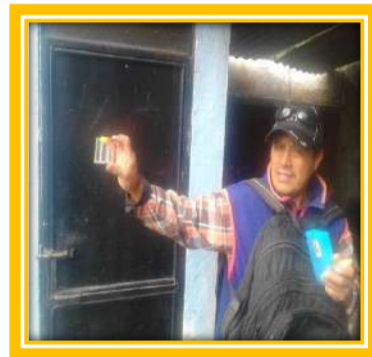
Instalación de pastillas y coordinación con personal del ISA para el monitoreo