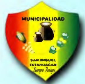
MUNICIPIO DE SAN MIGUEL IXTAHUACÁN, DEPARTAMENTO DE SAN MARCOS

Con base en datos oficiales del Centro de Atención Permanente CAP: