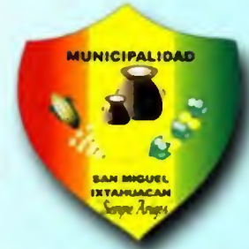
MUNICIPIO DE SAN MIGUEL IXTAHUACÁN, DEPARTAMENTO DE SAN MARCOS

Con base en datos oficiales del Centro de Atención Permanente CAP: