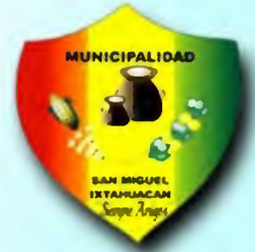
MUNICIPIO DE SAN MIGUEL IXTAHUACÁN, DEPARTAMENTO DE SAN MARCOS

Con base en datos oficiales del Centro de Atención Permanente CAP: